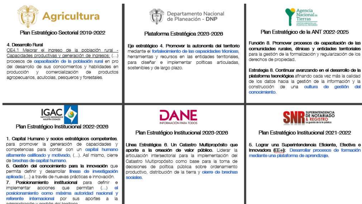
Figura 2. Objetivos estratégicos- Autoridades SAT socias del proyecto SwissTierras