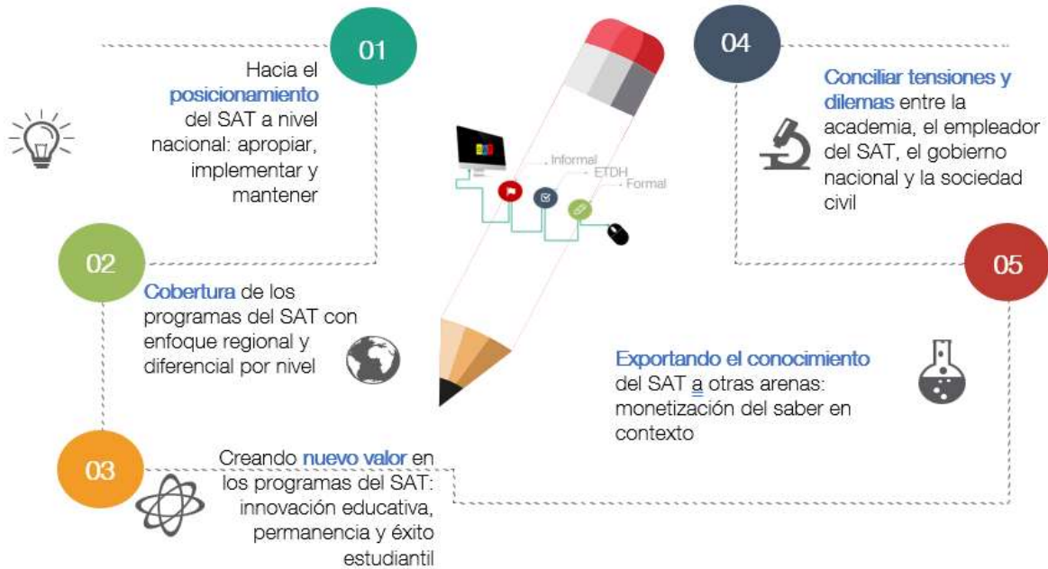
Figura 5. Cursos de acción estratégicos para la formación del SAT

La estrategia propone cinco cursos de acción estratégicos que atienden los objetivos de fortalecimiento de la educación formal, no formal (ETDH) e informal para cerrar las brechas de cantidad, calidad y pertinencia del capital humano descritas en el capítulo 1 de este documento. Las líneas estratégicas se desarrollan de manera secuencial y en la medida en que obtienen resultados, permiten a la gobernanza de la formación del SAT ajustar los programas, proyectos e iniciativas en las regiones para optimizar el uso de los recursos y alcanzar el logro de las metas e indicadores que se deben definir en el Cuadro de Mando Integral de la formación en administración del territorio.