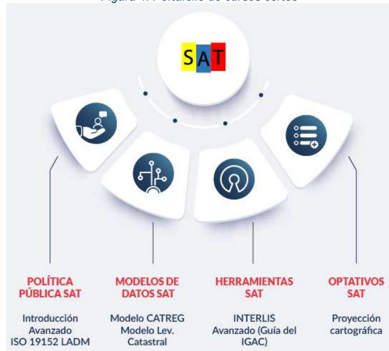
Figura 4. Portafolio de cursos cortos