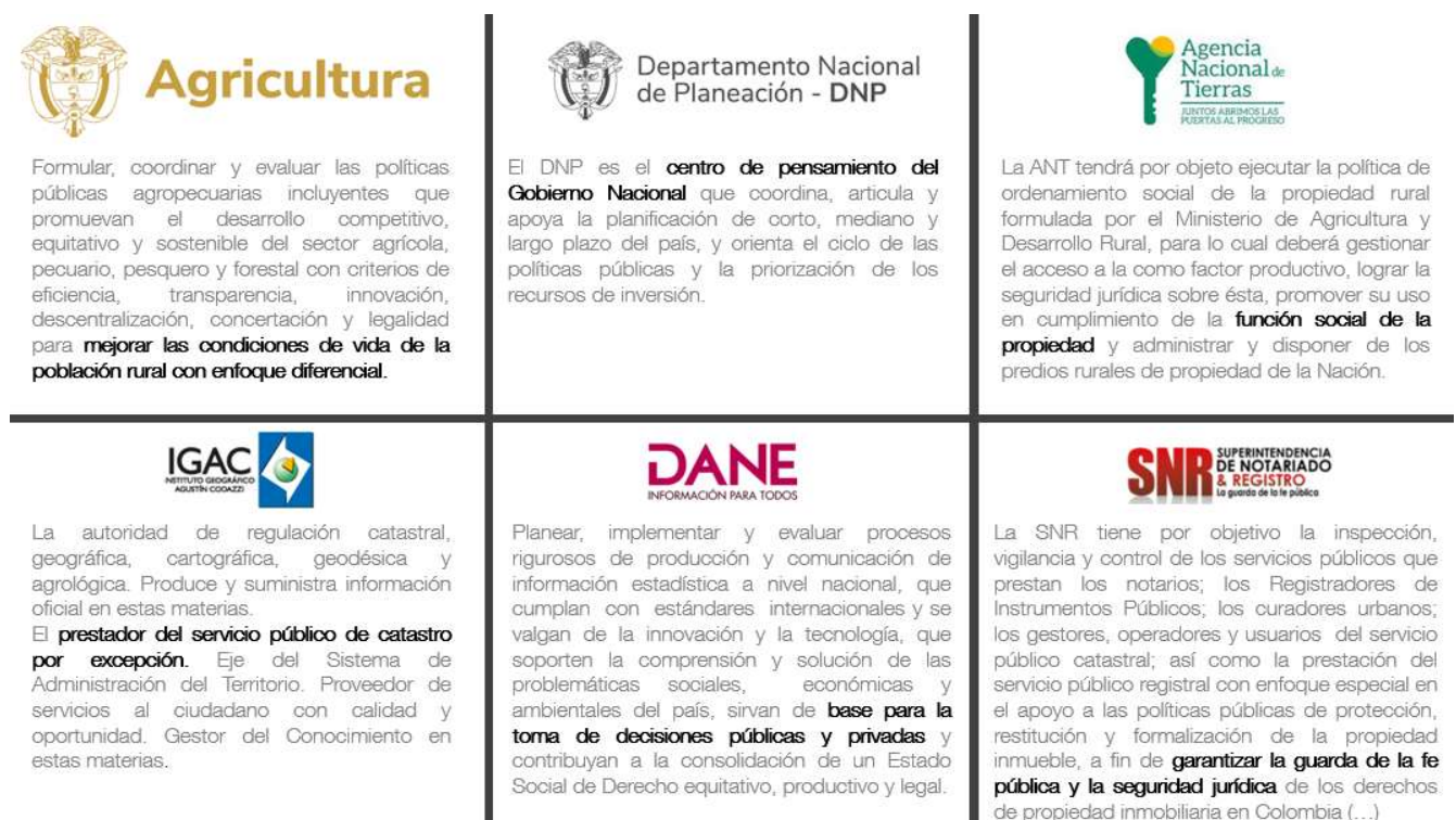
Figura 1. Misión de las autoridades SAT socias del proyecto SwissTierras

La identificación del propósito de cada una de las entidades socias del proyecto SwissTierras Colombia, con la justificación de la estrategia permite identificar las siguientes sinergias: de un lado, el MADR trabaja por mejorar las condiciones de vida de la población rural con enfoque diferencial (Minagricultura, s.f.), la ANT en la función social de la propiedad (Land Portal Org., 2015), el IGAC como el prestador del servicio público de catastro por excepción (IGAC, 2020) y la SNR para garantizar la guarda de la fe y la seguridad pública (SNR, s.f.); y de otro, el DNP es el centro de pensamiento del Gobierno Nacional (DNP, s.f.), el DANE encargado de garantizar la producción, disponibilidad y calidad de la información estadística estratégica, y dirigir, planear, ejecutar, coordinar, regular y evaluar la producción y difusión de información oficial básica (Congreso de la República, 2015).